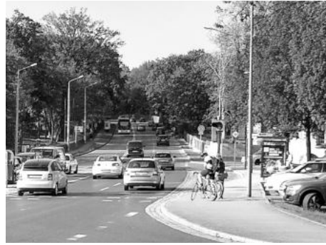
„Pauliberg“ von unten

Wenn die Petition genügend Unterstützer findet und die zuständigen Behörden zum Handeln bringt – dann können Radfahrer den Pauliberg bald gefahrlos befahren. Das wäre