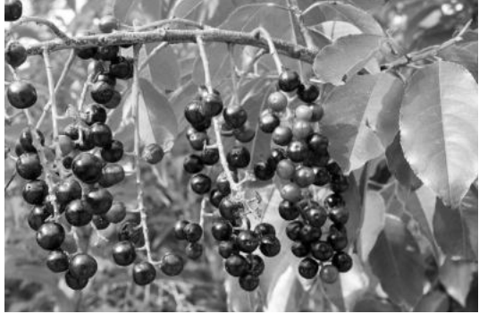
Spätblühende Traubenkirsche

europäischen Bedingungen die wirtschaftlichen Erwartungen der Forstwirtschaft nicht. Seit 1960 wird sie aufwändig, oft mit wenig Erfolg, bekämpft. Weiter pflanzt man sie als stark wachsendes Landschaftsgehölz und Straßenbegleitgrün.