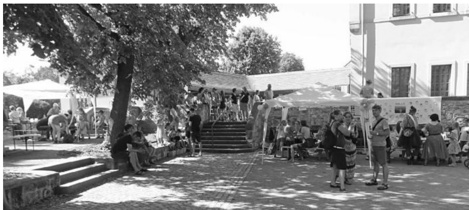
Das Bürgerzentrum Waldschänke wird vielfältig genutzt – wie hier beim Kinderfest 2019

Vorstand des Bürgerzentrums Waldschänke e.V.