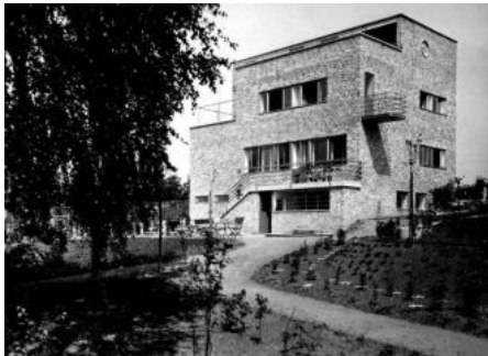
Haus Chrambach am Hohen Weg 11 im Jahr 1930