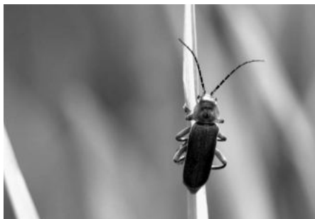
Cantharis rustica

Im Mai stellte sich aber heraus, dass die Aussaat von Bestandspflanzen, vor allem Quecke und Wicke, überwuchert wurde. So haben wir nach eingehender Diskussion gemeinsam mit dem