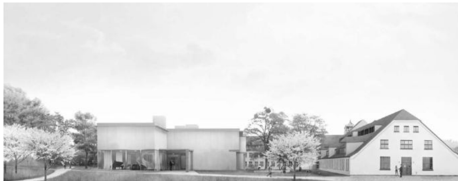
Blick auf den geplanten Neubau von Westen (Ansicht: Deutsche Werkstätten Hellerau)